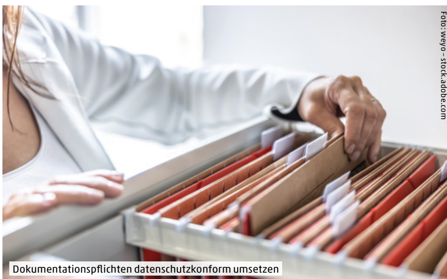
Dokumentationspflichten datenschutzkonform umsetzen

Das Verfahren sieht vor, dass die interne Meldestelle innerhalb von sieben Tagen nach Zugang der Meldung eine Bestätigung über deren Eingang an die hinweisgebende Person senden muss. Dabei erfolgt eine erste Prüfung der Meldung. Die interne Meldestelle ergreift dann Folgemaßnahmen, wie die Durchführung weiterer interner Untersuchungen oder die Einschaltung einer anderen zuständigen Stelle (z. B. Compliance oder die Behörden). Die hinweisgebende Person ist über den Fortlauf des Verfahrens bzw. die Folgemaßnahmen maximal drei Monate nach Bestätigung des Eingangs der Meldung bzw. – sollte in Ausnahmefällen keine Bestätigung erfolgt sein – drei Monate nach Ablauf der Frist von sieben Tagen nach Eingang der Meldung zu informieren. Die Rückmeldung kann unterbleiben, wenn dadurch die internen Nachforschungen oder Ermittlungen gefährdet würden oder die Rechte der gemeldeten Person beeinträchtigt würden.