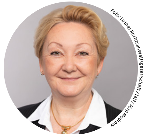
Gastautorin: Silvia C. Bauer , Rechtsanwältin, Partnerin, Datenschutzbeauftragte Luther Rechtsanwalts-gesellschaft mbH Köln